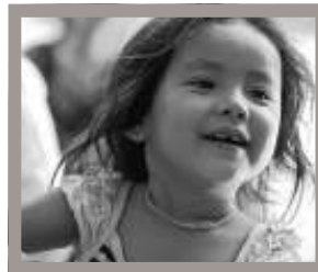
Mädchen im Slum von Phnom Penh

Spenden erbitten wir auf das Konto Nr. 300 959 01 (BLZ 520 900 00) bei der Kasseler Bank Bad Wildungen. Spendenquittungen werden auf Wunsch bei Angabe von Name und Adresse ausgestellt.