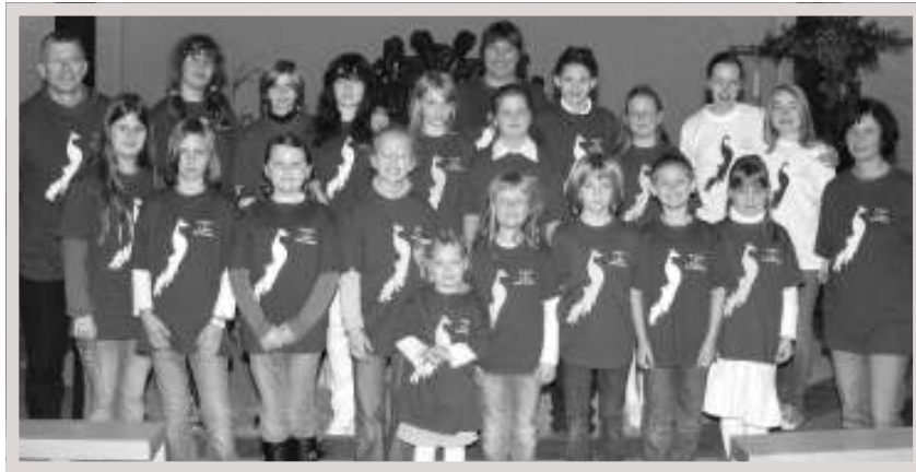
Die Kinder- u. Jugendgruppe „Les jeunes de St. Libori“ im neuen Outfit - Foto: Himstedt

Angefangen hatte alles im Herbst 2007. Unter dem Motto „Kochen, Backen und Basteln“ trafen sich Mädchen und Jungen der St.-Liborius-Gemeinde im Alter von acht bis elf Jahren einmal monatlich im Gemeindehaus, um gemeinsam mit zwei Müttern zu kochen, zu backen und zu basteln.