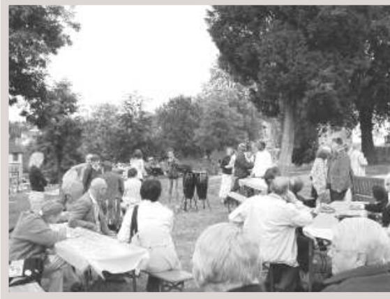
Jubiläumstreffen auf dem „alten Friedhof“